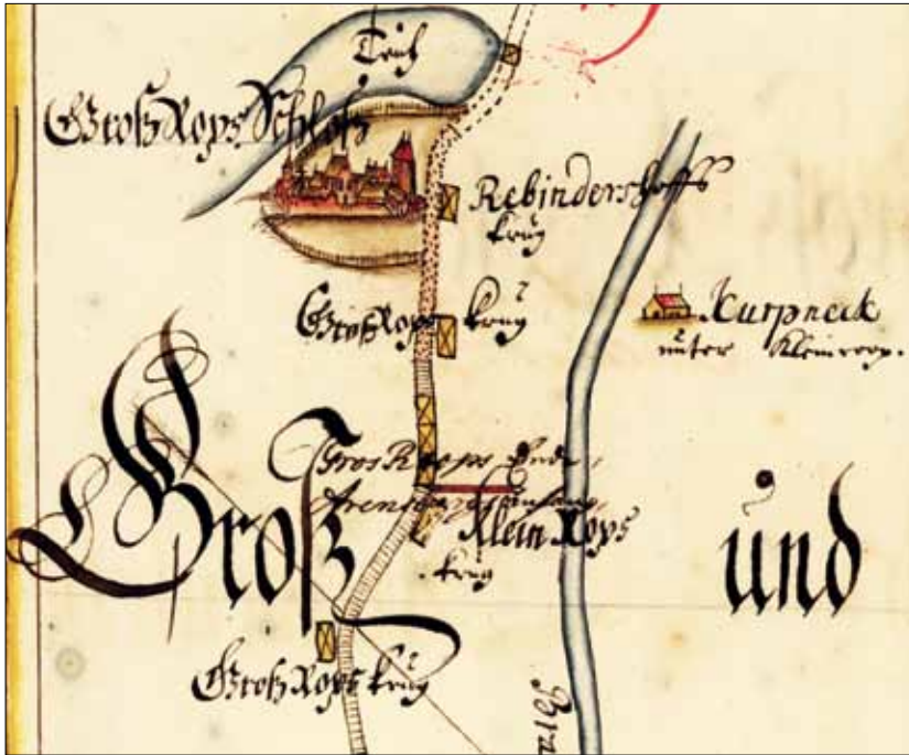
7. att. 1695. gada Lielstraupes un Mazstraupes ceļu kartes fragments. Pie uzraksta "Lielstraupes pils" ( Groß Rops Schloß ) attēlota pils un pilsēta, kuru apjož palisāde (LVVA, 7404-1-2195)

vai pilsētu apņēmušā grāvja iekšmalā. Šāda veida nocietinājumi noteikti nebija piemēroti ilgstošai aizsardzībai, turklāt prasīja regulāru uzturēšanu. Visdrīzāk, tie pilsētas iedzīvotājus aizsargāja no plēsīgajiem meža zvēriem, kā arī klejojošajām laupītāju bandām. Aizsardzības sistēma karaspēka aplenkumu spēja izturēt vien īsu laiku, iespējams, lai pagātu patverties pilī. Pilsētas nocietinājumi vienā pusē pieklāvās Braslas upei un otrā pusē saslēdzās ar pils aizsarggrāvjiem, kas savukārt otrā galā bija savienoti ar Braslu. Līdz ar to pilsēta un pils bija grāvju ietvertas, turklāt pilsēta pat ar diviem grāvjiem un zemes valni starp tiem. Ūdens resursi no nelielās ūdensteces, kas iztecēja no netālā purva, pa daļai tika uzkrāti pie pils esošajā ūdenskrātuvē, kas savienojās gan ar pilsētas, gan pils aizsardzības grāvjiem, un ūdenstece, jādodomā, tika regulēta ar slūžu palīdzību. Šajā vietā, domājams, atradās iepriekš minētās ūdensdzirnavas. Nepieciešamības gadījumā no uzplūdinājuma ātri varēja iegūt lielus ūdens resursus. Mūsdienās bez arheoloģiskiem izrakumiem