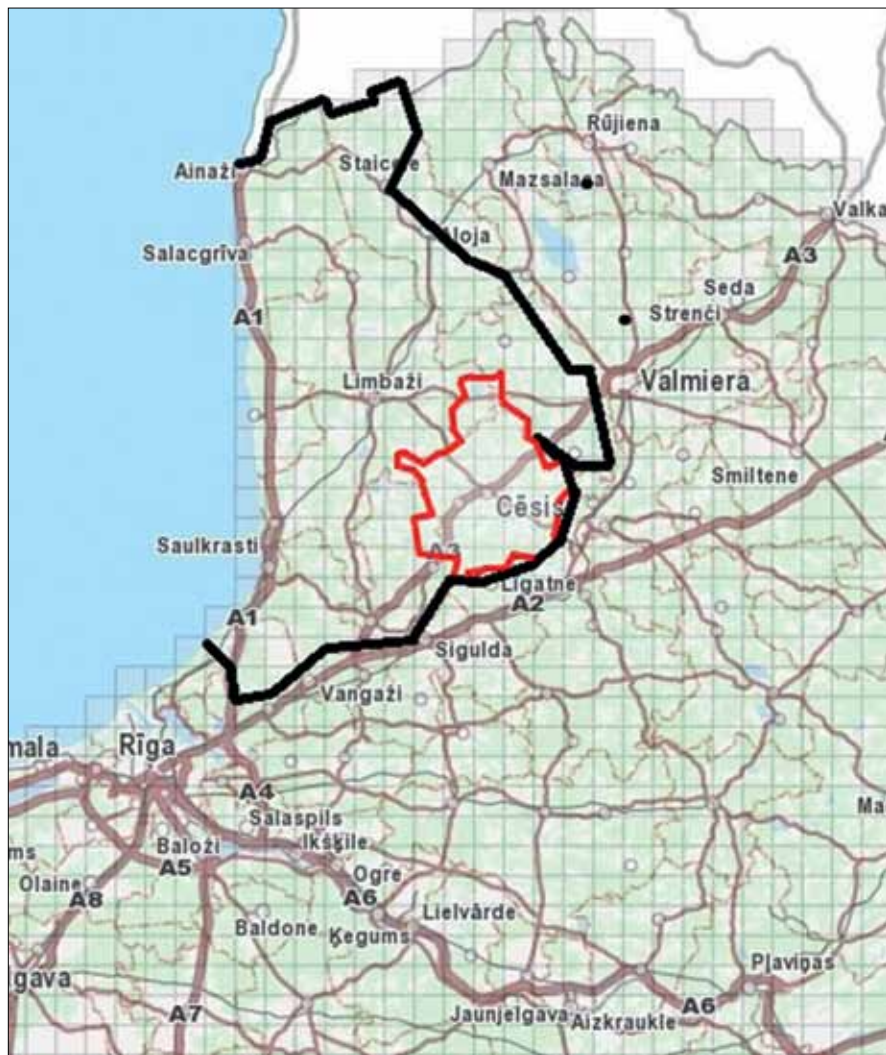
5. att. Rozenu dzimtai piederošo zemju lielums 14.–16. gs. (ar sarkanu līniju) un Rīgas arhibīskapijas Lībīšu gala robežās (ar melnu līniju). Karte no www.kurtuesi.lv , autora iezīmētas robežas

(5. att.), tās aizņēma aptuveni piektdaļu no arhibīskapijas zemēm, kas atradās Gaujas labajā krastā, jeb no t.s. Līvu gala. Taču jāatceras, ka pilīm piederošās zemes nebija pastāvīgs lielums, jo tās varēja mainīties mantošanas, 54 maiņas, 55 pirkšanas un pārdošanas 56 vai laulību darījumu rezultātā. 57 Atsevišķi ciemi vai lielākas teritorijas, kas vienā laika posmā piederēja pie vienas pils, pēc