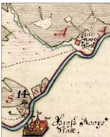
4. att. Lielstraupes pils (Groß Roops Slätt) un Mazstraupes pils (Klein Roops Slott) 1683. gada kartē. Fragments no 3. attēla