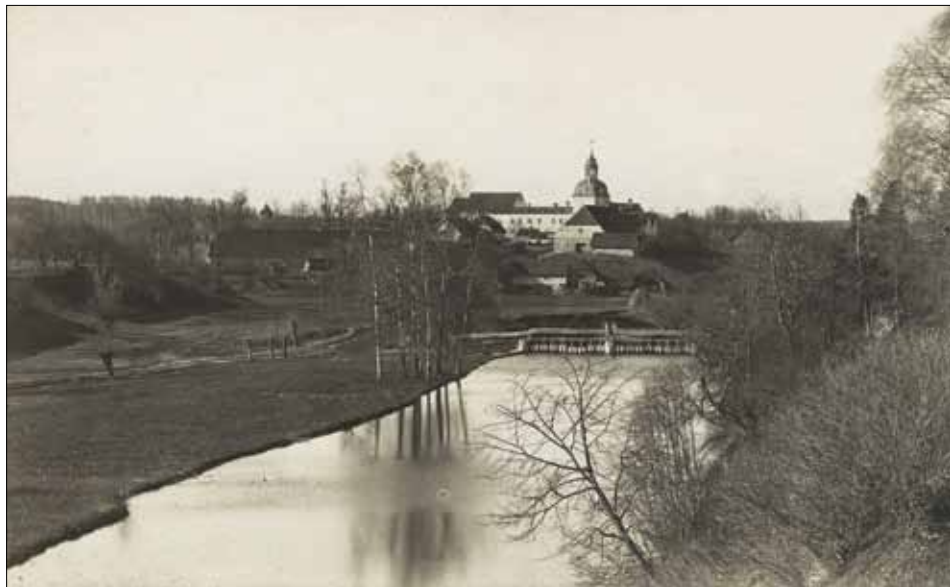
1. att. Lielstraupes pils skatā no ziemeļrietumiem. 20. gs. sākuma pastkarte