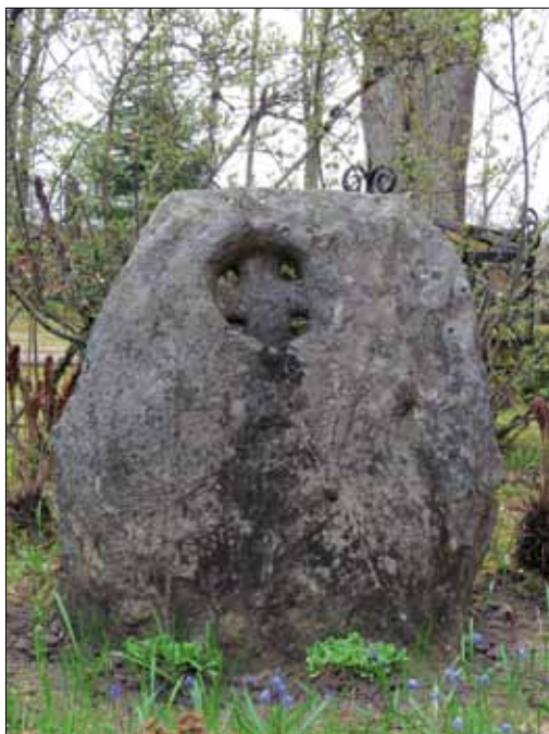
6. att. Krustakmens Straupes baznīcas ziemeļu pusē bijušās kapsētas teritorijā. Autora foto 2015. gadā

pieדרוֹšās Straupes daļa tika izmantota atsevišķu Rīgas pilsētas jautājumu risināšanā, piemēram, 1515. gadā gan pie Rīgas Doma, gan Straupes baznīcas durvīm novietoja paziņojumu saistībā ar Livonijas zemes maršalu. 73