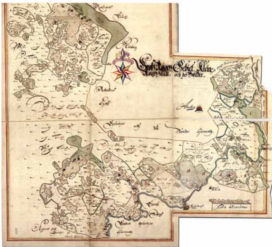
3. att. 1683. gada Lielstraupes pilsnovads un Mazstraupes pils vieta ar daļu no pilīm piederošajām zemēm, kas sadalītas ciemos un pagastos (LVVA, 7404–1–1909)