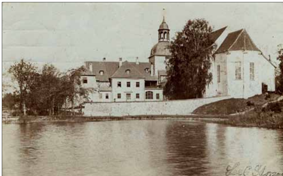
2. att. Lielstraupes pils skatā no dienvidaustrumiem. 20. gs. sākuma pastkarte